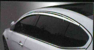
A474 PREMIUM CHROME DOORVISOR