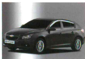
< 크루즈(5Door) / 크롬 도어바이저 >