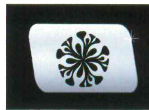
< 그랜저HG >