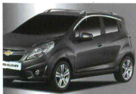
< 스파크 / 쌍카풀 >