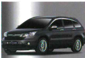
< CR-V / 프리미엄 크롬 도어바이저 >