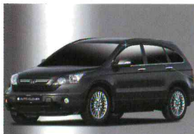
< CR-V / 프리미엄 아크릴 도어바이저 >