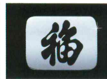
< 제네시스 >