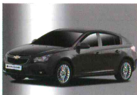
< 크루즈(5Door) / 스모크 도어바이저 >