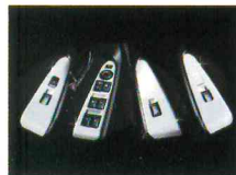
< 스포티지R / 인테리어 스위치 몰딩 >