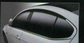
A124 PREMIUM ACRYLIC DOORVISOR