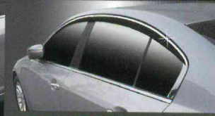
C002 PREMIUM DIAMOND DOORVISOR