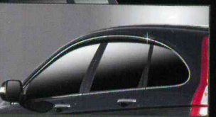
C004 PREMIUM DIAMOND DOORVISOR