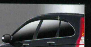
C031 PREMIUM ACRYLIC DOORVISOR