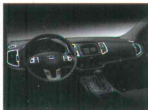
< 스포티지R / 인테리어 덕트 몰딩 >