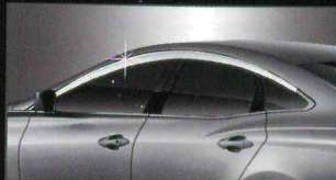
C060 PREMIUM CHROME DOORVISOR