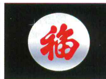
< 알페온 >