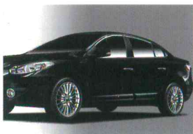
< SM3(2009) / 쌍카풀 >