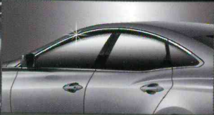
C003 PREMIUM DIAMOND DOORVISOR