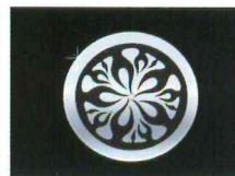
< 코란도C >