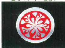
< 모닝(2011) >