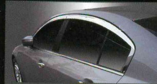
A480 PREMIUM CHROME DOORVISOR