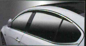
C001 PREMIUM DIAMOND DOORVISOR