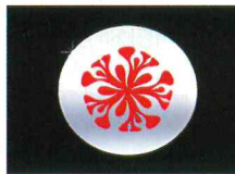
< 엑센트(2011) >