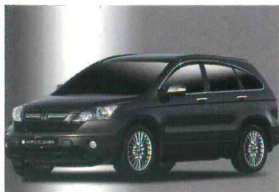
< CR-V / 프리미엄 다이아몬드 도어바이저 >

- 오토크로바 가니쉬, 몰딩 제품은 차체에 맞게 설계하여 시공 후 차의 라인을 살려주며, 세련된 디자인으로 외관을 더욱 돋보이게 한다. 신제품 주유구 커버 몰딩은 스티커 도안이 들어있어 다양한 스타일을 연출할 수 있다.(스티커 도안은 실제 제품과 다를 수 있음.)