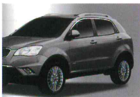
< 코란도C / 쌍카풀 >