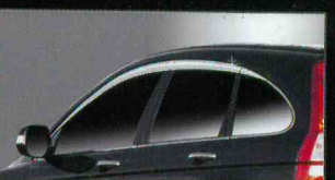
C061 PREMIUM CHROME DOORVISOR