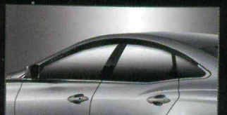
C030 PREMIUM ACRYLIC DOORVISOR