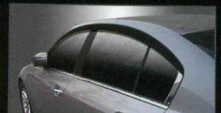
A125 PREMIUM ACRYLIC DOORVISOR