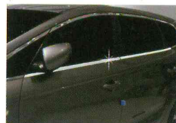
<올 뉴카렌스(2013)/윈도우 액센트>