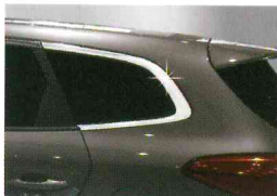
<올 뉴카렌스/C 필러 몰딩>