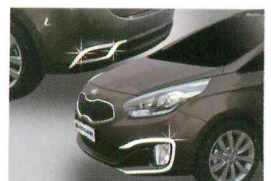
<올 뉴카렌스/포그 램프 가니쉬>