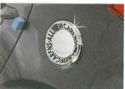
<올 뉴카렌스/풀 커버 몰딩>