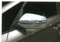
<올 뉴카렌스/사이드 미러 가니쉬>