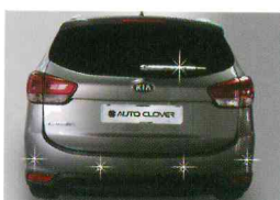
<올 뉴카렌스/리어 몰딩 키트>