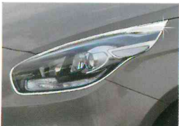
<올 뉴카렌스/헤드 램프 가니쉬>