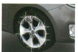
<올 뉴카렌스/휠 커버 몰딩>