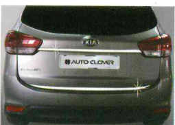
<올 뉴카렌스/트렁크 가니쉬>