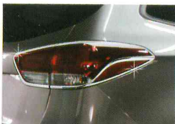
<올 뉴카렌스/리어 램프 가니쉬>