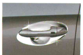
<올 뉴카렌스/도어 바울 몰딩>