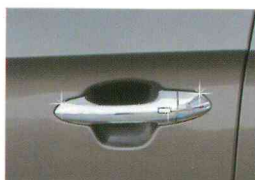
<올 뉴카렌스/도어 핸들 몰딩>