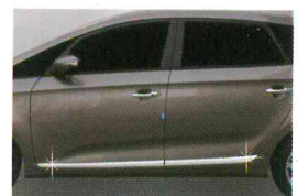
<올 뉴카렌스(2013)/사이드 스커트 액센트>