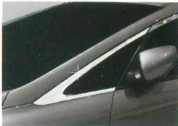
<올 뉴카렌스/A 필러 몰딩>