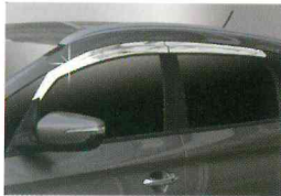
<올 뉴카렌스(2013)/크롬 도어바이저>