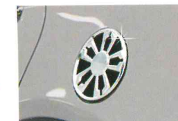
<그랜드 신타페/풀 커버 몰딩>