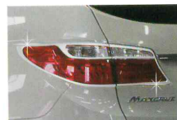
<그랜드 신타페/리어 램프 가니쉬>