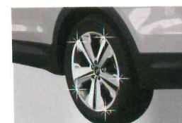
<그랜드 신타페/휠 커버 몰딩>