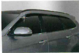
<그랜드 신타페/스모크 도어 바이저(6P)>