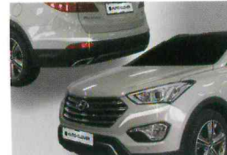
<그랜드 신타페/크롬 범퍼 몰딩>