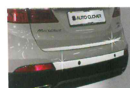
<그랜드 신타페/트렁크 가니쉬>