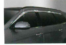
<그랜드 신타페/크롬 도어 바이저(6P)>