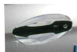
<그랜드 신타페/도어 바울 몰딩>