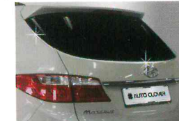
<그랜드 신타페/크롬 립 스포일러>