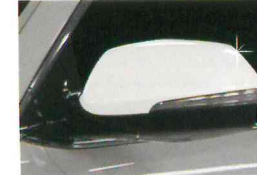
<그랜드 신타페/사이드 미러 가니쉬>