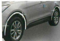
<그랜드 신타페/휠 아치 가드>