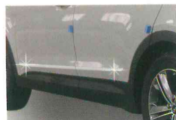
<그랜드 신타페/사이드 스커트 액센트>