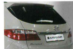
<그랜드 신타페/리어 몰딩 키트>