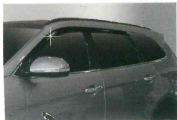
<그랜드 신타페/스모크 도어 바이저(4P)>