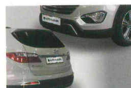
<그랜드 신타페/포그 램프 가니쉬>