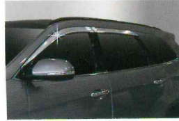
<그랜드 신타페/크롬 도어 바이저(4P)>