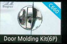
Door Molding Kit(6P)