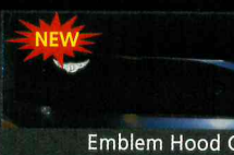
Emblem Hood Guard