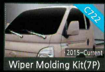
Wiper Molding Kit(7P)