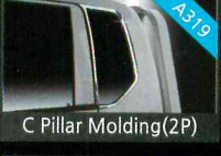
C Pillar Molding(2P)