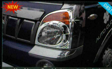
Head Lamp Garnish_Luxury Design(2P)