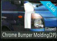
Chrome Bumper Molding(2P)