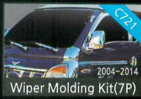
Wiper Molding Kit(7P)