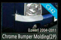
Chrome Bumper Molding(2P)