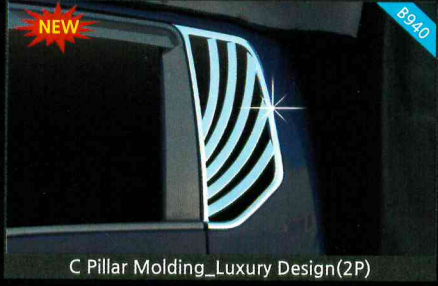
C Pillar Molding_Luxury Design(2P)