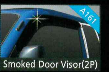
Smoked Door Visor(2P)