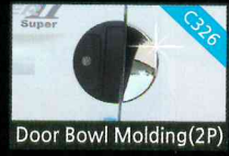
Door Bowl Molding(2P)