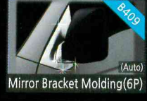
Mirror Bracket Molding(6P)