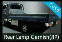
Rear Lamp Garnish(8P)