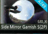
Side Mirror Garnish S(2P)