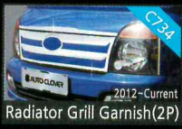
Radiator Grill Garnish(2P)