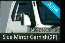
Side Mirror Garnish(2P)