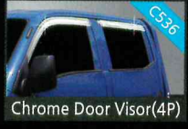
Chrome Door Visor(4P)