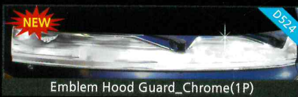
Emblem Hood Guard_Chrome(1P)