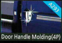
Door Handle Molding(4P)