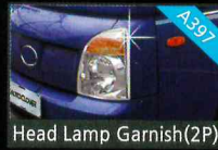
Head Lamp Garnish(2P)