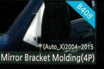
Mirror Bracket Molding(4P)