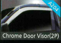
Chrome Door Visor(2P)