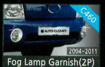
Fog Lamp Garnish(2P)