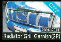
Radiator Grill Garnish(2P)